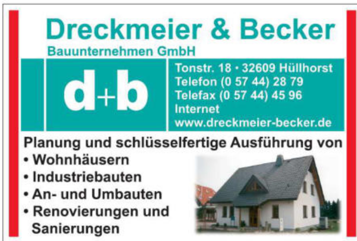
Das Musterhaus an der B239