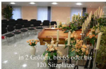
in 2 Größen, bis 65 oder bis 120 Sitzplätze

Im Trauerfall Tag und Nacht erreichbar Tel. 05223/71263