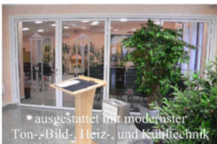
• ausgestattet mit modernster Ton-, Bild-, Heiz-, und Kühltechnik

Auf Wunsch zeigen wir Ihnen auch gern unsere neuen Räumlichkeiten. Wenn sie Fragen zu Gestaltungsmöglichkeiten oder Preisen haben, rufen Sie an und vereinbaren einfach einen Termin mit uns.