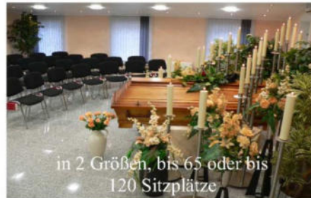
in 2 Größen, bis 65 oder bis 120 Sitzplätze

Im Trauerfall Tag und Nacht erreichbar Tel. 05223/71263