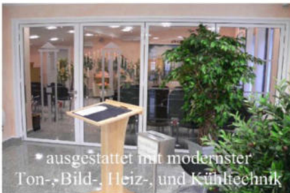
* ausgestattet mit modernster Ton-, Bild-, Heiz-, und Kühltechnik

Auf Wunsch zeigen wir Ihnen auch gern unsere neuen Räumlichkeiten. Wenn sie Fragen zu Gestaltungsmöglichkeiten oder Preisen haben, rufen Sie an und vereinbaren einfach einen Termin mit uns.