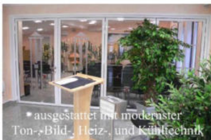
• ausgestattet mit modernster Ton-, Bild-, Heiz-, und Kühltechnik

Auf Wunsch zeigen wir Ihnen auch gern unsere neuen Räumlichkeiten. Wenn sie Fragen zu Gestaltungsmöglichkeiten oder Preisen haben, rufen Sie an und vereinbaren einfach einen Termin mit uns.