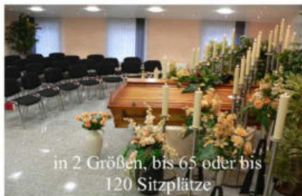
in 2 Größen, bis 65 oder bis 120 Sitzplätze

Im Trauerfall Tag und Nacht erreichbar Tel. 05223/71263