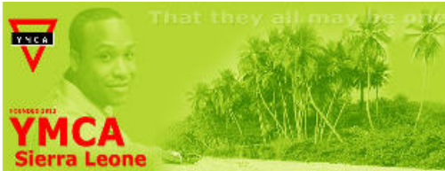
Weltdienst-Kreis CVJM Stift Quernheim

→ aktuelle Info's zur Situation in Sierra Leone und zur Partnerschaftsarbeit