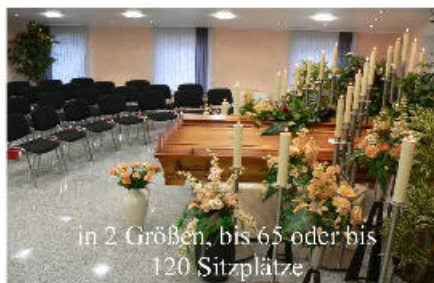
in 2 Größen, bis 65 oder bis 120 Sitzplätze

Im Trauerfall Tag und Nacht erreichbar Tel. 05223/71263