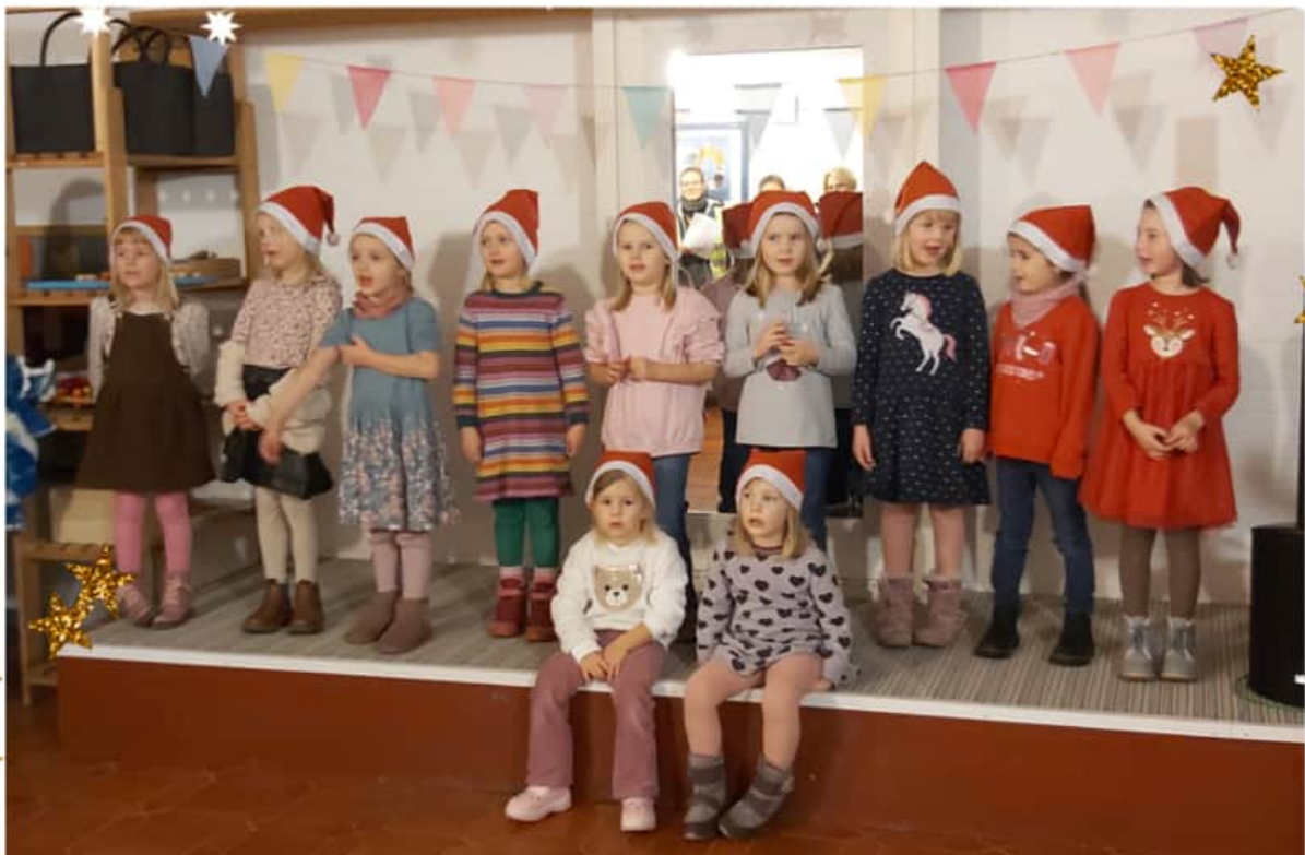
"Im Advent unterwegs" in der Kita Stift Quernheim.

Die Resonanz bei allen Teilnehmern war deutlich: Gerne wollen wir auch dieses Jahr wieder „im Advent unterwegs“ sein.