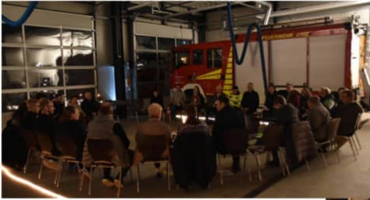
Die Feuerwehr als Gastgeber am 11.12.24.