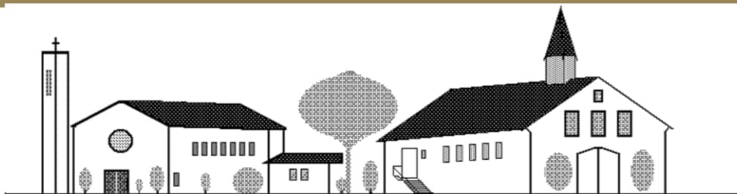
St. Canisius / St. Xaverius Stift Quernheim